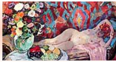
Gevoelskleuren Jan Sluijters in Singer Museum