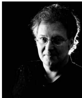
Luc Morjau.

Lambik als de Spaanse veldheer Valdez. Tante Sidonia als Magdalena Moons. Suske en Wiske zijn kinderen die via onderaardse gangen heen en weer pendelen tussen het belegerde Leiden en het Spaanse legerkamp buiten de stadspoort. De oersterke Jerom draagt als voorman van de Geuzen zorg voor de bevrijding van de geplaaide stad. De bekende stripfiguren spelen in het nieuwste album 'Het Lijdende Leiden' allemaal een andere rol.